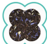
EARL GREY INGOLF