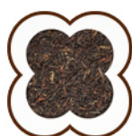
BREAKFAST TEA LATTE